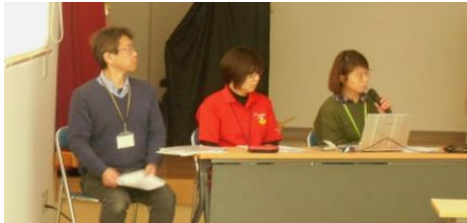
認知症ケア専門士による講義

平成29年2月18日、愛宕地区公民館にて地域の方々にお集まり頂き「認知症になっても、住み良い街づくりを目指して」をテーマに介護教室が開催されました。